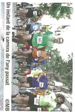
Un instant de la carrera de l'any passat.

El preu d'inscripció és de 3€, i es dedicarà un Euro solidari a Càritas. Les inscripcions es poden fer a les Piscines i a www.mfjaterrassa.org fins al 27 d'agost a les 19h. També s'acceptaran inscripcions a les Piscines els dies 28 i 29, però els participants no constaran a les classificacions ni podran rebre cap premi. La recollida del dorsal i l'obsequi es podrà fer el dia 29 al Gimnàs Municipal i el mateix dia de la cursa al Pavelló des de les 16:30h. Aquells que hagin adquirit el xip groc (al preu d'11€) també el podran recollir.