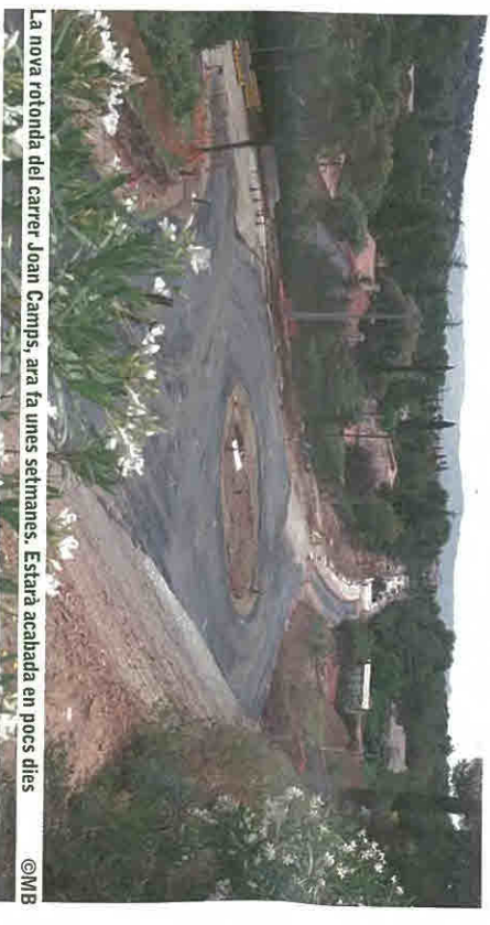
La nova rotonda del carrer Joan Camps, ara fa unes setmanes. Està acabada en pocs dies.

això, la nova rotonda a la cruïlla del carrer Joan Camps haurà de tancar-se temporalment durant un parell de dies per poder realitzar aquestes tasques. A més, encara quedaran pendents les feines de jardineria, que es realitzaran a l'octubre, ja que és la millor època per plantar la vegetació.