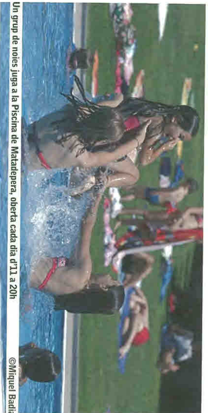
Un grup de noies juga a la Piscina de Matadepera, oberta cada dia d'11 a 20h.

Obertes cada dia fins al 14 de setembre, festius inclosos, entre les 11h del matí i les 20h del vespre, sense tancar al migdia.